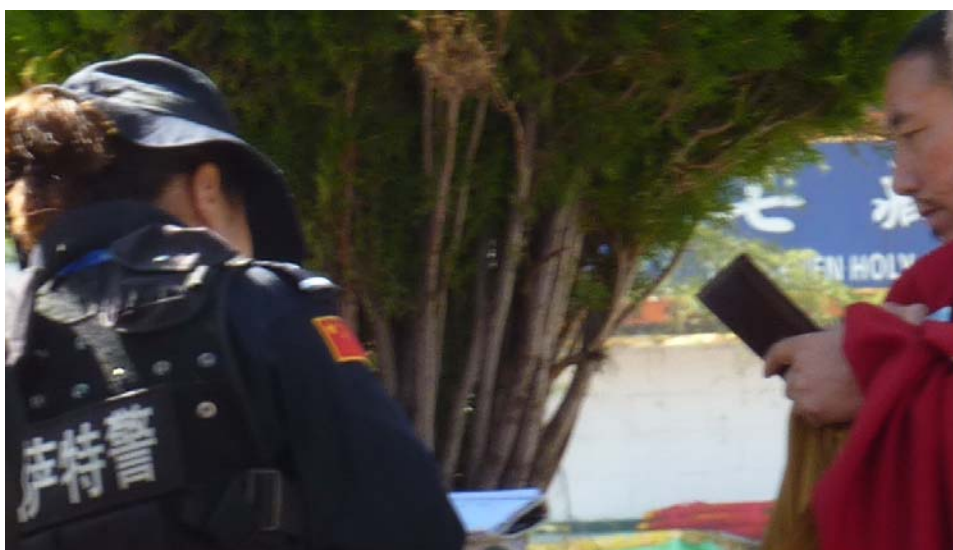
Polizist und Mönch in Lhasa

Während der Ära der chinesischen Reform und Öffnung war Lhasa generell der Ort, an dem die tibetische Elite wohnen wollte. Ich traf viele junge Tibeter, die nach ihrem akademischen Abschluss in großen Städten wie Peking oder Shanghai hätten bleiben können, es aber vorzogen, in Lhasa, das zu der Zeit weit von irgendwelchem geschäftigen Treiben entfernt war, zu leben und zu arbeiten. Im Frühling 1990 kehrte ich von Kham in meine Geburtsstadt Lhasa zurück, denn ich wusste, dass es dort Kollegen aus Amdo in der Literaturgesellschaft der TAR gibt.