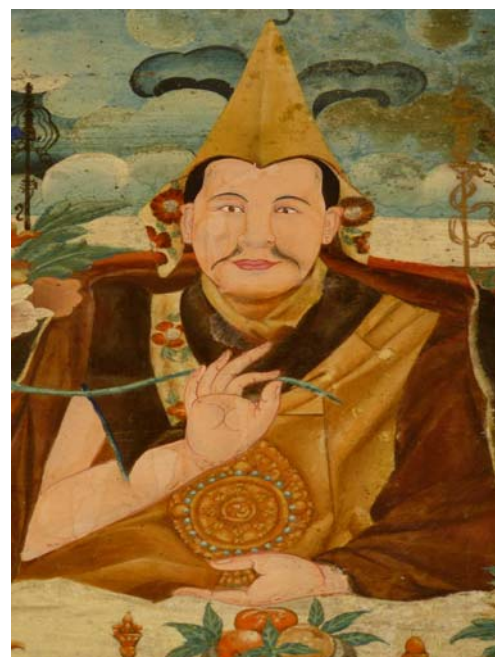
Eine Frau verbeugt sich vor dem Wandbild, auf dem oben in der Mitte die Figur des Dalai Lama zu sehen ist